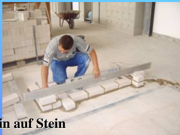
Stein auf Stein