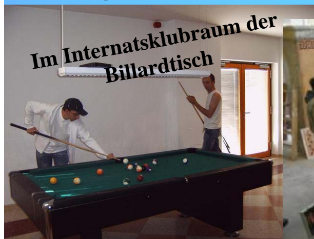
Im Internatsklubraum der Billardtisch